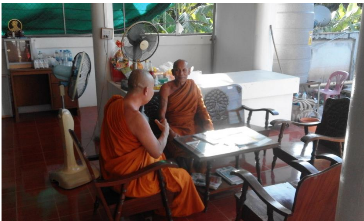
สัมภาษณ์พระสอนศีลธรรม