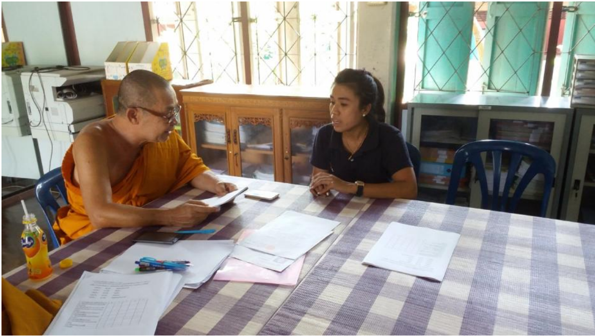
สัมภาษณ์ครูโรงเรียนวัดประชาโฆสิตาราม