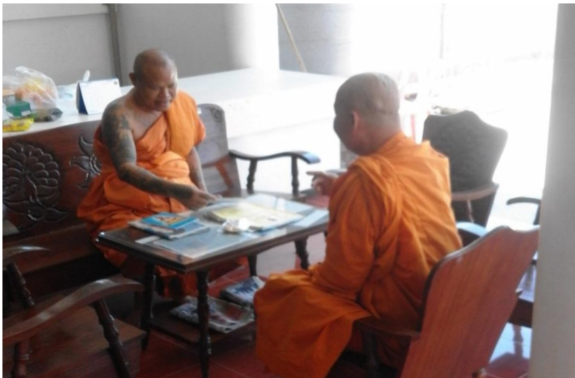
สัมภาษณ์พระสอนศีลธรรม