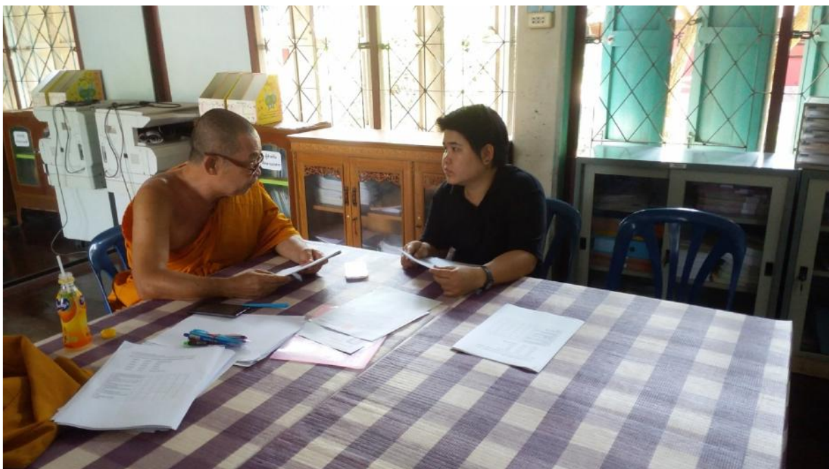
สัมภาษณ์ครูโรงเรียนวัดประชาโฆสิตาราม