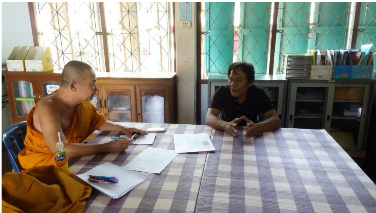
สัมภาษณ์หัวหน้าหมวดสังคมโรงเรียนวัดประชาโฆสิตาราม