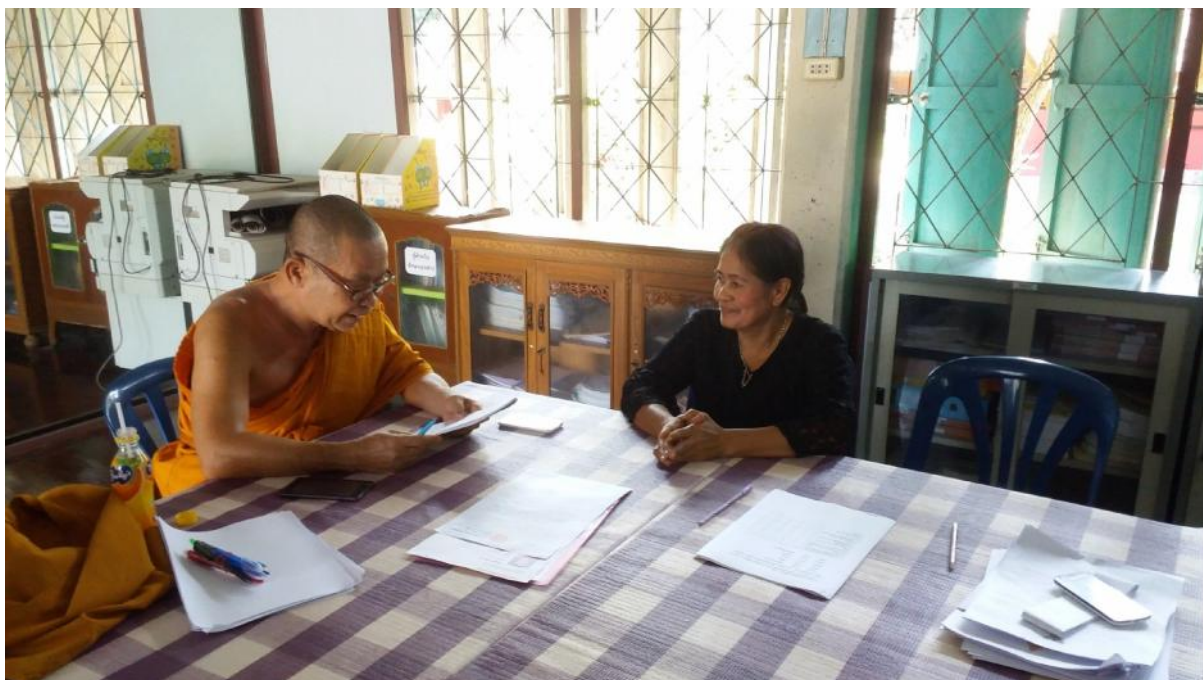
สัมภาษณ์ผู้อำนวยการโรงเรียนวัดประชาโฆสิตาราม