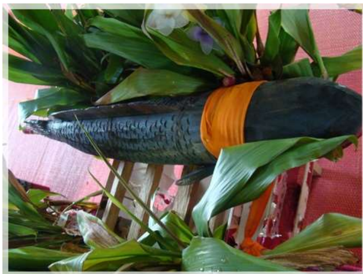
ภาพที่ ๔.๖ เทศนาธรรมปลาช่อน วัดบ้านขุนทา ตำบลแม่ออน อำเภอแม่ออน จังหวัดเชียงใหม่

พอเข้าสู่วันใหม่ก็ได้เดินทางนำข้างเผือกมาถวายไว้ที่วัดพระธาตุหริภุญชัยเป็นอันสิ้นสุด ขบวนแห่ข้างเผือก และจากการทำบุญทอดผ้าป่ารักษาลำน้ำแม่ทาครั้งได้รวบรวมจำนวนเงินร่วมทำบุญจากศรัทธาพี่น้องในกลุ่มน้ำแม่ทาจำนวนเบื้องต้นทั้งสิ้น ๔๔,๓๖๖.๒๕ บาท รวมกับ คณะกรรมการวุฒิสมาชิกได้ให้ไว้เป็นกองทุนอีก ๕,๐๐๐ บาท รวมจำนวนหมด ๔๙,๓๖๖.๒๕ บาท เพื่อเป็นกองทุนรักษาลำน้ำแม่ทา