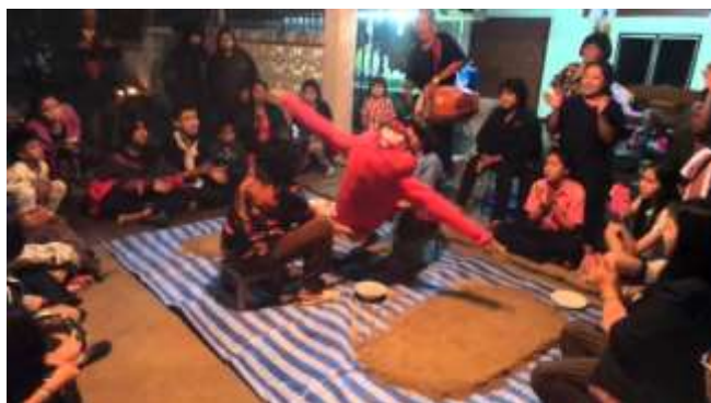
ภาพที่ ๒.๘ การเล่นแม่นางก๊วก

เล็กน้อย กะให้ไม้คานยื่นออกไปสองข้างเท่าๆ กัน เพื่อทำเป็นแขน ทั้งก๊วกและไม้คานจะเป็นของแม่ฝ่ายหรือแม่ฮ้าง มัดไม้คานกับก๊วกติดกันให้แน่น แล้วเอาเสื่อมาสวมให้ก๊วก เมื่อพร้อมแล้วผู้หญิง ๒ คนนั่งลง มือจับปากก๊วก หันหน้าเข้าหากัน ให้ก๊วกอยู่กลาง ให้ไม้คานที่ทาเป็นแขนยื่นออกไปสองข้าง จับก๊วกยกขึ้น เมื่อพร้อมแล้วทำพิธีป่าวสักเคอ อัญเชิญเทวดาและวิญญาณอันศักดิ์สิทธิ์เข้ามาสิงก๊วก พร้อมกับร้องคาซึ่งแม่นางก๊วก ก๊วกจะเต้นหรือดิ้น จะมีการซักถามและเสี่ยงทายเช่นเดียวกับนางดั่ง