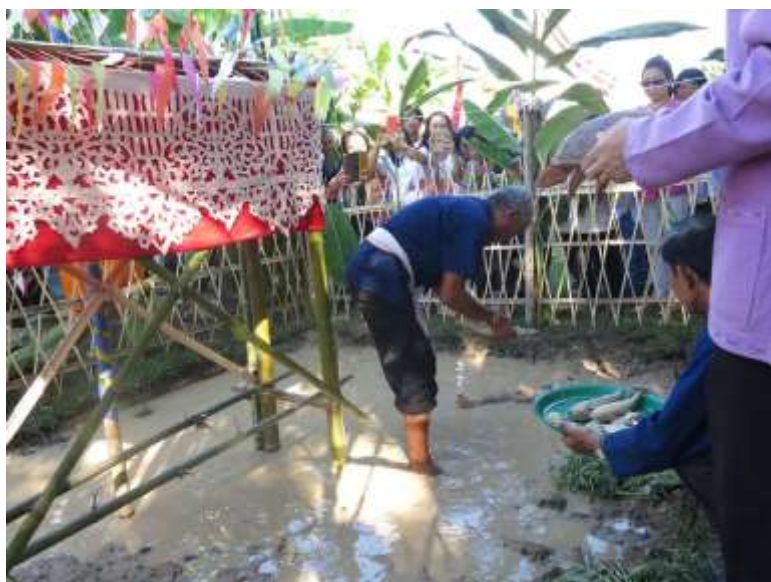
ภาพที่ ๔.๗ ปล่อยปลาลงในสระน้ำจำลอง

๕. ธรรมนิยาม คือกฎธรรมชาติเกี่ยวกับความสัมพันธ์เป็นเหตุเป็นผลกันของสรรพสิ่ง ความเป็นไปตามธรรมดา หรือธรรมชาติของคน สัตว์ และสิ่งของ รวมไปถึงความเป็นกฎธรรมชาติ ฉะนั้น มนุษย์ สัตว์ และสรรพสิ่งตามธรรมชาติ ตามนิยามของพระพุทธศาสนานั้นตกอยู่ภายใต้ นิยาม ตาม “กฎธรรมชาติ” กฎนี้ครอบคลุมความสัมพันธ์ทุกส่วนทั้งจักวาล ตามกฎทั้ง ๕ สามารถสรุปความ ได้ว่า หลักธรรมนิยาม ถือว่าเป็นนิยามร่วม หรือนิยามสากล ของสิ่งที่ปรากฏในนิยามทั้ง ๔ ที่กล่าวมา เช่น สามัญญลักษณะ ได้แก่ ความไม่เที่ยง เป็นทุกข์ และอนัตตภาวะ รวมเป็นนิยามของสรรพสิ่งทั้ง มวล ๕๕