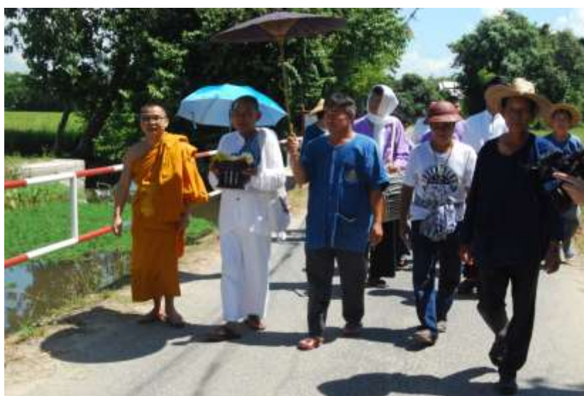
ภาพที่ ๓.๓ ขบวนแห่อัญเชิญพระอุปัชฌาย์จากห้วยน้ำในชุมชน

“ในการทำพิธีเทศน์ธรรมพญาปลาช่อน เป็นงานที่ใหญ่งานหนึ่งของสังคมระดับหมู่บ้าน การจัดเตรียมพิธีก็มีความซับซ้อน ต้องอาศัยคนทำงานจำนวนมาก ต้องอาศัยความมานะบากบั่นพอสมควร ดังนั้น คนทำงานก็ต้องมีหลักอิทธิบาท ๔ คือ มีฉันทะร่วมกันว่าจะประกอบพิธีกรรมให้ดีขึ้น มีวิริยะความพยายาม เพราะอย่างเครื่องประกอบพิธีกรรมก็มีมาก บางครั้งบางอย่างก็หาซื้อไม่ได้ ต้องจัดทำขึ้นมาเอง และจิตตะ คือการทำงานทุกอย่างมักมีปัญหาเฉพาะหน้าที่ต้องแก้ไขทั้งเรื่องงบประมาณ ของใช้ จนถึงคนที่ทำงานด้วยกัน เพราะมีคนทำงานหลายฝ่ายที่ต้องประสานงานกัน และสุดท้าย คือ วิมังสา เราต้องวิเคราะห์รวบรวมข้อมูลทั้งผิดพลาดไว้เพื่อใช้แก้ปัญหาหรือทำให้รวดเร็วขึ้น เมื่อทำพิธีกรรมอีกในคราวหน้า” ๔๒