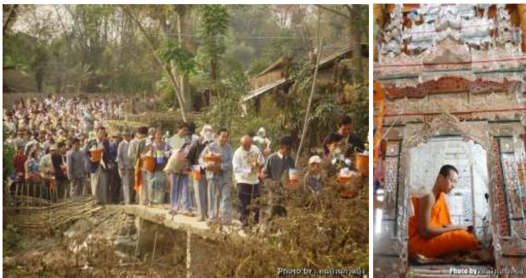
ภาพที่ ๒.๑๗ พิธีตั้งธรรมว้าวหลวง กาดบุง เมืองเชียงใหม่

ชาดกเรื่องที่ยอดนิยมที่สุดในเชียงใหม่ รองจากเรื่องเวสสันดรชาดก เห็นได้จาก วัดในเมืองเชียงใหม่ เช่น ที่วัดพระธาตุดอยจอมคา วัดเชียงใหม่ มีภาพจิตรกรรมฝาผนังเรื่องนี้ นอกจากนี้ยังพบอยู่บนตุงด้วย เช่น ตุงที่ได้จากวัดราชฐานหลวง ป่าแดง เป็นต้น ชาวไทขิ่นครุฑธาและนับถือเป็นที่ยิ่ง ทุกๆ วัดจะมีการเทศนาธรรมเรื่องนี้ และมีการเขียนภาพธรรมและจัดทำปราสาทเสาดียวตามเนื้อเรื่องในชาดกและ ถวายทานเป็นประจำ ชาวไร่ชาวนาเมืองเชียงใหม่ นับถือชาดกเรื่องนี้มาก ถือว่าเป็นเรื่องที่ฟังแล้วจะชุ่มน้ำชุ่มเย็น ทำให้เกิดความอุดมสมบูรณ์ ดังนั้น เมื่อตั้งธรรมว้าวหลวงแล้วจึงมักอธิษฐานให้สมปรารถนาด้วย