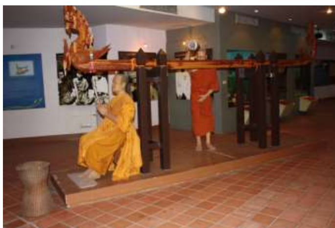
ภาพที่ ๒.๑๔ โฮงหด และพิธีฮตสรง (รดน้ำ)

คนไทขาวเชื่อว่า ตัวเงือกเป็นผู้ให้น้ำฝนจึงบูชาผิวน้ำด้วยควายตอนในพิธีเช่นเมือง หลังพิธีในตอนบ่ายหนุ่มสาวจะสาดน้ำเล่นใส่กัน ส่วนคนไทใต้คงและคนลาวใช้รางรดน้ำเป็นรูปนาคสำหรับรดสิ่งศักดิ์สิทธิ์ ซึ่งเมื่อพระพุทธศาสนาเผยแผ่เข้ามา พิธีรดน้ำดำหัวก็ได้ใช้กับพระพุทธรูปและพระสงฆ์ด้วย ในฐานะเป็นสิ่งศักดิ์สิทธิ์ที่พุทธศาสนิกชนให้ความเคารพนับถือ ชาวไทใต้คงเรียก “กงซอน” ลาวเรียก “โฮงหด” หรือ “ฮงหด” ในวันที่ ๓ ของงานปีใหม่ของชาวไทลื้อจะมีประเพณีอาบน้ำก่อนกา (เหมือนไทพวน) โดยจะหาบน้ำไปให้ผู้เฒ่าผู้แก่สระหัวแต่เช้ามีดก่อนการร้อง หลังจากนั้นก็จะไปรดน้ำผู้ใหญ่และสาดน้ำใส่กันระหว่างหนุ่มสาว ๓๑