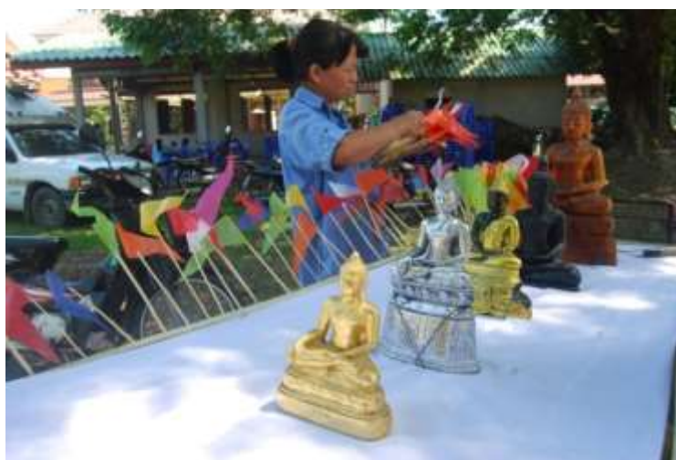
ภาพที่ ๒.๒๔ พระพุทธรูป ๕ พระองค์

เมื่อถึงกำหนดที่จะกระทำพิธีขอฝน คนทั้งหลายตีฆ้องกลอง หรือ เครื่องดุริยดนตรี นำพานดอกไม้ ธูปเทียน และเครื่องทำว ๕ ประการ ไปอาราธนาอัญเชิญแม่พระพุทธรูปหิน พระพุทธรูปเงิน พระพุทธรูปทองคำ พระพุทธรูปไม้จันทน์ และพระพุทธรูปสีหิงค์ จากวัดต่างๆ ที่มี ถ้าไม่มีให้สมมุติเอาพระพุทธรูปที่สร้างด้วยวัตถุอื่นว่าเป็นพระพุทธรูปที่ต้องการ แล้วนำมาประดิษฐานในปะรำพิธี