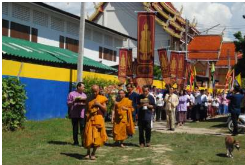
ภาพที่ ๔.๕ ขบวนแห่ในพิธี

ในทางเดียวกัน และสนับสนุนหนุนเสริมกันเพื่อให้ฝนตก ถือเป็นตัวอย่างให้คนได้เห็นความสามัคคีกัน” ๓๒