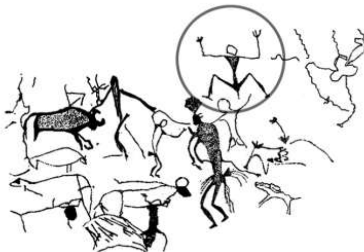
ภาพที่ ๒.๑๐ ปั้นเมฆ แสดงอวัยวะเพศหญิง (รูปที่ทำวงกลมล้อมรอบ)

การปั้นหุ่นร่วมเพศนั้น มีชื่ออีกอย่างว่า ปั้นเมฆ เป็นคำเก่าแก่ดั้งเดิม หมายถึงพิธีขอฝน โดยทำรูปอวัยวะเพศหญิงกับชายไว้กลางแจ้งขนาดใหญ่และอุจาดที่สุด บางทีปั้นรูปหญิงชายร่วมเพศ เพราะเชื่อว่าทำให้มีน้ำฝนพุ่มหล่นจากเมฆบนฟ้า