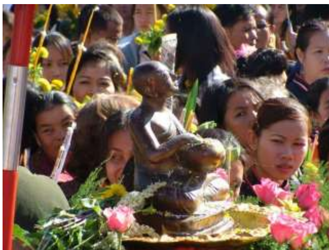
ภาพที่ ๒.๑๙ พิธีแห่พระอุปัคต