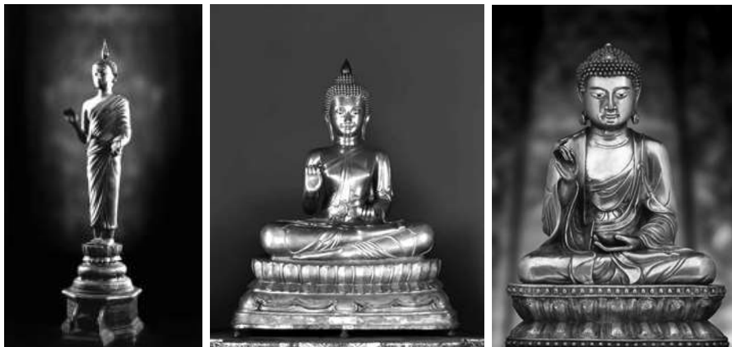
ภาพที่ ๔.๙ พระคันธารราชฎ์ประทับยืน ประทับนั่ง และแบบจีน ๖๔

ประกาศนี้ก็กล่าวถึงที่มาของพระพุทธรูป คันธารราชฎ์ที่สร้างขึ้นหลังพระพุทธเจ้าปรินิพพาน ๒๑๑ ปีเศษ ด้วยพระเจ้าแผ่นดินแห่งแคว้นคันธารราชฎ์ฟังเรื่องพระพุทธเจ้าบังนาคลฝนแล้วทรงเลื่อมใสให้สร้างพระพุทธรูปปางดังกล่าว อีกทั้งถ้าได้เชิญพระพุทธรูปปางนี้ออกมาบูชาเมื่อมีฝนแล้ง ฝนก็ตกดังประสงค์ ดังนั้น จึงมีผู้นับถือศาสนาพุทธสร้างพระพุทธรูปปางนี้สืบต่อมาและได้ชื่อตามแคว้นที่เกิดว่า พระพุทธรูปคันธารราชฎ์”