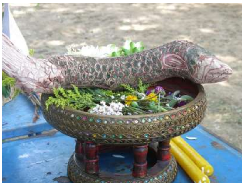
ภาพที่ ๒.๒๒ ไม้แกะสลักรูปปลาช่อน

สถานที่ จัดที่กลางทุ่งนา หรือเกาะทราย ขุดสระกว้างประมาณ ๓ เมตร ยาวประมาณ ๔ เมตร ลึกประมาณ ๑ เมตร ตั้งเสาให้เป็นร้านหรือแท่นที่กลางสระ เพื่อเป็นที่ประดิษฐาน พระพุทธรูป สูงจากขอบสระประมาณ ๑ เมตร ล้อมบริเวณสระด้วยราชวัตร ฝังต้นกล้วยต้นอ้อย ปัก ด้วยข้อ ตุง เป็นเครื่องบูชาคัมภีร์ธรรม ตักน้ำใส่สระเล็กน้อย แล้วปล่อยรูปปลาช่อนและรูปปลาเล็ก ปลาน้อยลงไปในสระนั้น รอบขอบสระข้างบนตั้งรูปนกกระยาง รุ่ง กา และเหยี่ยวແหลว ตั้งหออุทิศ ตั้งหอท้าวทั้ง ๔ ตั้งหอเทวบุตร ๒ ตน และตั้งปะรำพิธีไม่ห่างกับสระมากนัก ๖๓