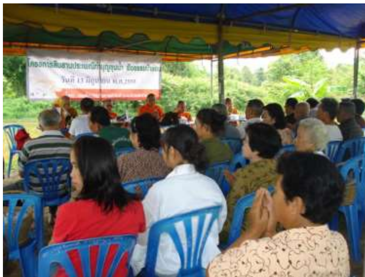
ภาพที่ ๔.๑ ประเพณีฝังธรรมปลาช่อนบ้านแม่ตาด ตำบลห้วยทราย อำเภอสันกำแพง จังหวัดเชียงใหม่

ประธานความชุ่มชื้นและความอุดมสมบูรณ์มาให้กับชุมชนตลอดทั้งปี เป็นการสืบชะตาให้กับสายน้ำ แสดงความกตัญญูต่อสายน้ำที่ได้หล่อเลี้ยงชีวิตให้กับชาวชุมชน ซึ่งเป็นอีกรูปแบบหนึ่งของการอนุรักษ์ทรัพยากรธรรมชาติและสิ่งแวดล้อมที่ชาวบ้านได้ช่วยกันสืบสานต่อๆ กันมาตั้งแต่ครั้งโบราณกาล เพื่อช่วยกันอนุรักษ์สายน้ำต่างๆ ให้มีความสะอาดบริสุทธิ์และอุดมสมบูรณ์อย่างยั่งยืนตลอดไป