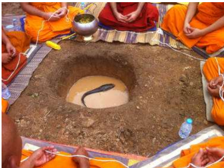
ภาพที่ ๔.๒ พิธีสวดคาถาปลาช่อน ตำบลศรีเทพ อำเภอศรีเทพ จังหวัดเพชรบูรณ์