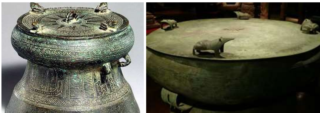
ภาพที่ ๒.๓ กลองมโหระทึกมีประติมากรรมรูปกบด้านบน