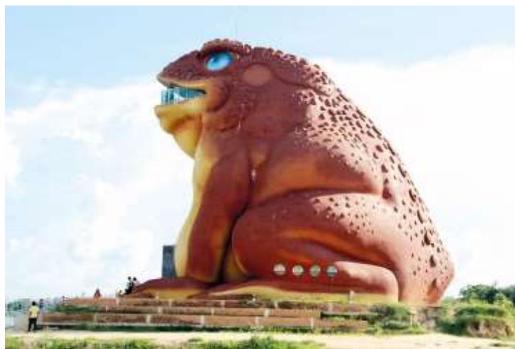
ภาพที่ ๒.๑๕ รูปปั้นพญาคันคาก

ในการทำพิธีชาวบ้านจะปลูกปะรำขึ้นที่กลางบ้าน ชุดสระลิกพอสสมควรแล้วใส่น้ำลงสระ เอาจอก แหน มาใส่ พร้อมกุ่ม หอย ปู ปลา เต่า วางไว้ที่ขอบสระปั้นรูปสัตว์บกและต่อ แตน อึ่ง กบ เขียด พร้อมจัดส่งเครื่องบูชาใส่พานวางไว้ บางแห่งก็นำคางคกเป็นๆ สวมเสื้อสีแดงมาใส่ไว้ด้วย เอาบัวมาปลูก ตามขอบสระให้ทำรูปช้าง ม้า วัว ควาย ฝรั่ง ต่อ แตน กบ เขียด อึ่งอ่าง แล้วจัดเครื่องฮ้อยหมากฮ้อยจอกหนึ่ง เมียงฮ้อยจอกหนึ่ง ข้าวตอกฮ้อยจอกหนึ่ง (หมายถึงอย่างละ ๑๐๐ อันรวมเข้าใส่ในจอก ขนาดใหญ่พอบรรจุได้ เช่น ข้าวตอกฮ้อยหนึ่งจอก หมายความว่า ข้าวตอกแตกบ้านเราร้อยดอก (เม็ด) ใส่ไว้ ๑ จอก เป็นต้น) ต่อจากนั้น ตอนเย็นชาวบ้านจะมารวมกัน พระสงฆ์เจริญพระพุทธมนต์ แล้วเทศน์พญาคันคาก ชาวบ้านจะนั่งฟังเทศน์แล้วสมาทานศีลห้า ตั้งจิตอธิษฐานขอให้ฝนตก ทำเช่นนี้จนครบ ๓ วันเป็นเสร็จพิธี ๓๓