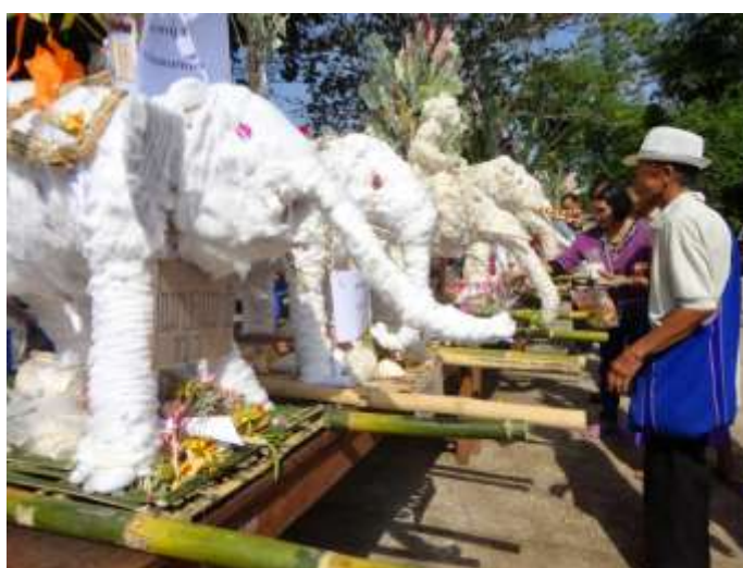
ภาพที่ ๒.๑๘ พิธีแห่ช่างผ้าขอฟน

เป็นนิจ บ้านเมือง อาณาประชาราชอยู่สุขสบายมาโดยตลอด ด้วยเพราะบุญญาบารมีของพระองค์ ประกอบกับช่างคู่มือคือช่างปัจจัยนาเคนทร์ที่ทุกคนเชื่อว่าช่างปัจจัยนาเคนทร์ทำให้บ้านเมืองอุดมสมบูรณ์ การให้ทานของพระเวสสันดรนั้นให้ได้ทุกอย่างด้วยความบริสุทธิ์ใจเพราะต้องการบำเพ็ญทานบารมีในชาติก่อนที่จะได้เป็นพระพุทธเจ้าในชาติต่อไป คือให้ได้แม่กระทิงเมียและลูกที่เฒ่าชูชกมาขอไปเลี้ยงและเอาไว้เป็นข้ารับใช้ ที่สำคัญพระเวสสันดรให้ช่างปัจจัยนาเคนทร์แก่บ้านเมืองอื่น เพราะบ้านเมืองที่แห้งแล้งฝนไม่ตกก็จะพากันมาทูลขอช่างปัจจัยนาเคนทร์ไปไว้ที่เมืองของตนจะได้ชุ่มชื้น เนื่องจากช่างปัจจัยนาเคนทร์อยู่ที่ใดที่นั้นก็อุดมสมบูรณ์ จึงมีแต่คนอยากได้และพระเวสสันดรก็ได้ให้ไปซึ่งฝ่ายพระเจ้าสฤษดิ์ชัยพระบิดาไม่ยอมเสียช่างปัจจัยนาเคนทร์ไป แต่พระเวสสันดรก็อยากให้ทานพระเจ้าสฤษดิ์ชัยจึงขับไล่พระเวสสันดร นางมัทรี กัณหาและชาลี ออกจากเมือง แต่ถึงกระนั้นพระเวสสันดรก็มีวางเว้นจากการให้ทานพร้อมส่งสอนลูกเมียให้หมั่นให้ทานเรื่อยมา เรื่องราวของช่างปัจจัยนาเคนทร์ที่นำความอุดมสมบูรณ์มาให้ จึงได้มีการจัดพิธีแห่ช่างปัจจัยนาเคนทร์ขึ้นมีการจำลองเหตุการณ์ที่เหมือนจริงตามเรื่อง มีคนเล่นเป็นพระเวสสันดร นางมัทรี กัณหา ชาลี เฒ่าชูชก มีการนำไม้ไผ่ ผ้า กระดาษสีต่างๆ มาทำเป็นช่างตัวใหญ่มหึมาสวยงาม มีการแห่จากหมู่บ้านหนึ่งไปยังอีกหมู่บ้านหนึ่งและขับร้องกลอนลำเป็นเรื่องราวระหว่างทาง ตลอดขบวนแห่ก็มีการสาดน้ำ ฟ้อนรำ สนุกสนานกันทั่วหน้า