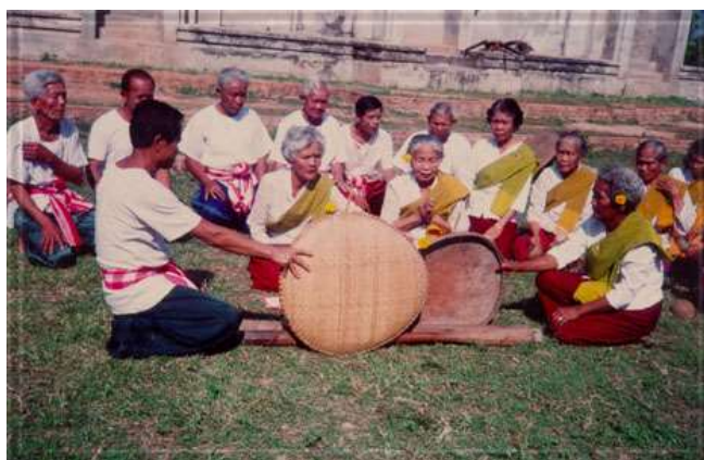
ภาพที่ ๒.๗ การเล่นแม่นางตั้ง

รูปแบบการเล่นแม่นางตั้ง เป็นการเล่นในแบบการเข้าทรงเพื่อขอฝนเมื่อเกิดฝนแล้ง และมีการเสี่ยงทายว่าฝนจะตกหรือไม่ และถ้าตกจะตกเมื่อใด เป็นต้น โดยใช้วัสดุ คือ กระดิ่ง ๒ ใบ ไม้คาน ๒ คู่ ซึ่งต้องเป็นของแม่มายหรือแม่ฮ้างนำมามัดติดกันโดยมัดไม้คานไขว้กัน ดอกหลักสองข้าง กระดิ่ง สมมติให้หลักหนึ่งเป็นหลักแล้ง อีกหลักหนึ่งเป็นหลักฝน จะให้คนสองคนจับไม้คานไว้คนละข้างโดยวางกระดิ่งราบกับพื้นดิน ทำพิธีป่าวสัศเคแล้วว่ คำแข็งแม่นางตั้ง เป็นวรรคๆ เมื่อคำแข็งจบบทหนึ่ง แม่นางตั้งจะเคลื่อนที่แสดงว่ามีผีมาสิงแล้ว จะถามเกี่ยวกับฝน หากนางตั้งเคลื่อนไปตีหลักฝน แสดงว่าฝนจะตก หากเคลื่อนไปตีหลักแล้งแสดงว่าจะไม่มีฝน นอกจากนี้อาจถามเรื่องอื่นก็ได้ เช่น ถามเรื่องของหาย เป็นต้น