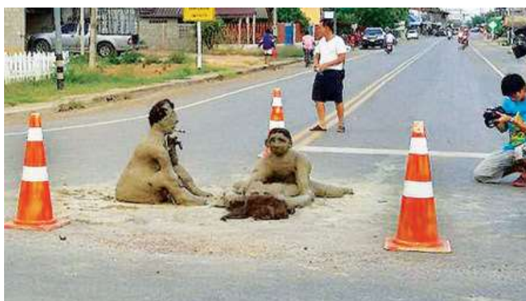
ภาพที่ ๒.๑๓ การปั้นเมฆในปัจจุบัน (ที่มา: ข่าวสด ฉบับวันพุธที่ ๘ กรกฎาคม ๒๕๕๘ หน้า ๑)

คำขบบอกเล่าเรื่องราวบรรพชนในพิธีเลี้ยงผี มีพรรณนาการร่วมเพศเพื่อขอฝน เช่น คำเล่าความเมืองของผู้ไทในเวียดนาม เป็นต้น ตำนานเมืองพระนครหลวง (นครธม) ในกัมพูชา เชื่อว่าทุกคืนนางนาคแปลงร่างเป็นสาว เพื่อร่วมเพศสมพาสกับพระราชอาบนปราสาท ถ้าคืนใดพระราชอาไม่ร่วมเพศสมพาสกับนางนาคคราวนั้นพระราชาก็จะถึงกาลวิบัติ และบ้านเมืองจะล่มจม มีกฏมณฑลยธาบาลกรุงศรีอยุธยา ระบุว่าพระราชพิธีเบาะพอกที่พระเจ้าแผ่นดินต้องเสด็จไปบรรทมกับแม่นางเมือง (เรียกแม่หยั่วพระพี) ในพระตำหนักศักดิ์สิทธิ์ (หมายถึงพระเจ้าแผ่นดินต้องทรงร่วมเพศสมพาสกับนางนาคซึ่งเป็นแบบแผนดั้งเดิมที่สืบจากกัมพูชา) ๓๐