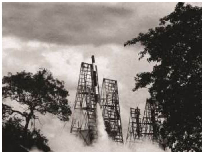
ภาพที่ ๒.๑ บั้งไฟ