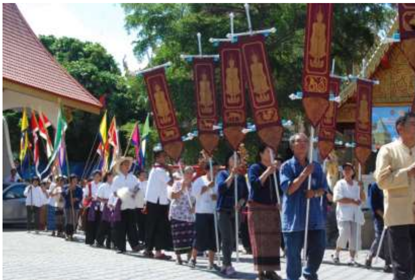
ภาพที่ ๓.๔ กลุ่มชาวบ้านทุกเพศวัยเข้าร่วมชบวนแห่

ทั้งจากเทศบาล บริษัทห้างร้านต่างๆ รวมไปถึงโรงงานจากวัดใกล้เคียง และที่ชาวบ้านนำมาเลี้ยงดู แยกหรือที่มาจากในงาน ถือเป็นความร่วมมือบุญร่วมทานกัน และเป็นการอนุรักษ์ประเพณีไว้ให้คนรุ่นหลังได้รู้ ได้เห็นต่อไป” ๕๔