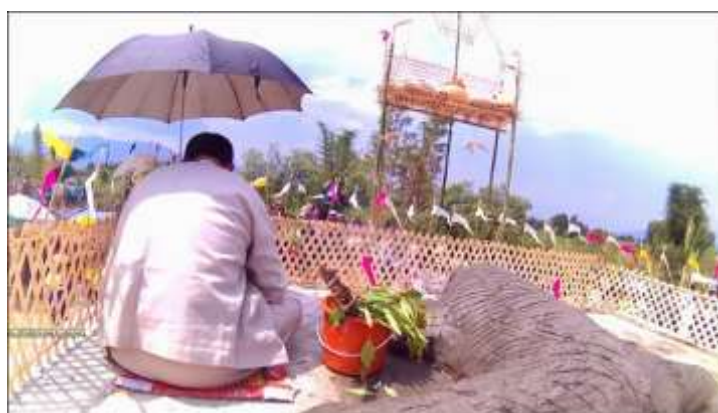
ภาพที่ ๒.๔ ขุนสังฆานต์เป็นรูปกบ

ในวันส่งสังฆานต์ เดือน ๖ วันขึ้นปีใหม่ของชาวไทจีนแบ่งออกเป็น ๔ วัน วันแรกเป็น วันสังฆานต์ล่อง ชาวบ้านชาวเมืองจะพากันไปที่กาด (ตลาด) เพื่อจับจ่ายซื้อของ วันที่ ๒ เป็นวันส่งสังฆานต์ วันที่ ๓ เป็นวันเนา และวันที่ ๔ เป็นวันพญาวันมาหรือวันขึ้นปีใหม่ ในวันที่ ๒ ซึ่งเป็นวันส่งสังฆานต์ ชาวไทจีนจะทำรูปขุนสังฆานต์แห่แหนไปสู่ล້องกบ ซึ่งอยู่ทางทิศตะวันตกของเมืองเชียงตุง เป็นร่องน้ำที่แยกมาจากลำน้ำจีน