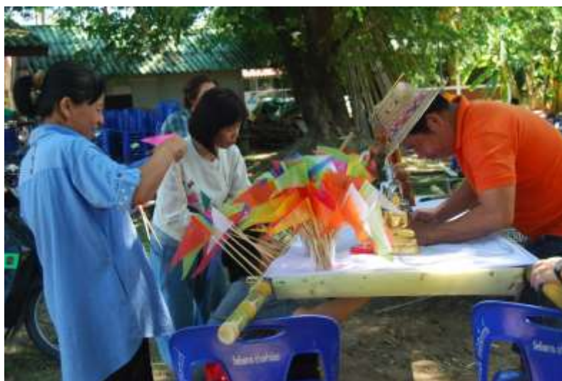
ภาพที่ ๓.๒ ชาวบ้านเสียสละเวลาช่วยเหลือกันทำเครื่องสักการะ

สนับสนุนปัจจัยมาสองหมื่นบาทให้มาจัดพิธี จะเห็นว่าได้รับการสนับสนุนมาจากทุกภาคส่วนของสังคม” ๒๗