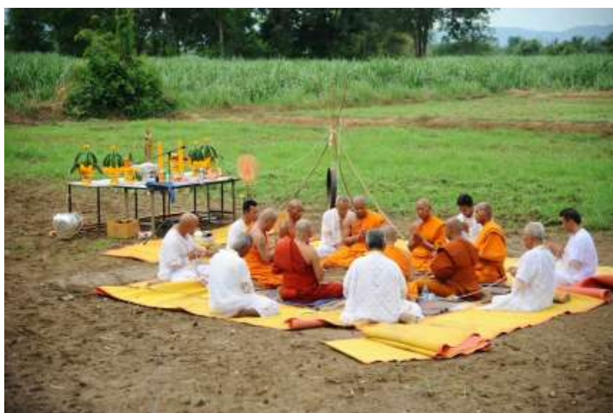
ภาพที่ ๒.๒๐ พิธีสวดคาถาปลาช่อน

พิธีขอฝนที่พบว่ามี การแพร่กระจายไปในไทหลายกลุ่ม ได้แก่ สวดคาถาปลาช่อน (ลาว ไทจีน ไทใต้คง ไทสยาม) ชาวไทยภาคอีสาน เรียก การสวดคาถาปลาช่อน เป็นการทำพิธีเมื่อฝนแล้งอีกวิธีหนึ่งเช่นกัน พิธีกรรมนี้มีมาจากนิบาตชาดก เรื่องเล่าว่า ครั้งเมื่อพระโพธิสัตว์เสวยพระชาติเป็นปลาช่อน (ปลาช่อน) อาศัยอยู่ในลำห้วยแห่งหนึ่ง เกิดฝนแล้งน้ำในบึงแห้งงวดเข้าทุกที สัตว์น้ำต่างๆ ได้รับความทรมานยิ่ง พระโพธิสัตว์จึงกระทำสัตยาธิษฐาน ประกาศว่าผู้มีศีลไม่เคยกินสัตว์อื่นเลย ด้วยคำสัตย์ดังนี้ขอฝนจงตกลงมาเพื่อช่วยสัตว์ทั้งหลายให้พ้นทุกข์ เมื่อกล่าวจบก็ได้กล่าวคาถาขอฝน เมื่อจบคำนั้นฝนก็เกิดตกลงมาทำใหญ่ จึงเชื่อกันว่าผู้ใดทำบุญและสวดคาถาปลาช่อนจะช่วยให้ฝนตกมาได้ โดยในวันทำพิธี ชาวบ้านจะนิมนต์พระสงฆ์มาเจริญพระพุทธมนต์เป็นเวลา ๓ วัน โดยสวดเจ็ดตำนาน อย่างย่อ แล้วสวดคาถาปลาช่อนให้ได้ครบ ๑๐๘ คาบ