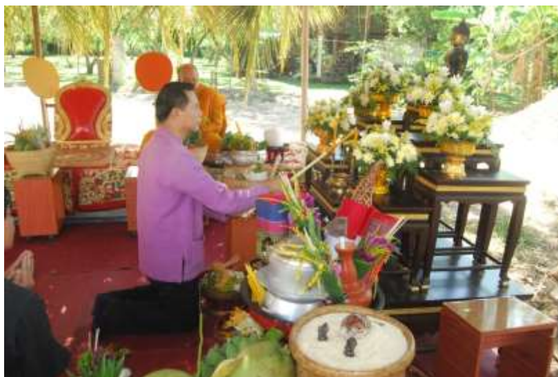
ภาพที่ ๒.๒๕ ประรำพิธี

จากนั้นนิมนต์พระสงฆ์เข้านั่งในประรำพิธี อาจารย์จุดเทียนธูปบูชาพระ แล้วกล่าวนำให้ พระสมათานศีล พระสงฆ์สวดมนต์ด้วยบท นะโมเม พุทธคาถา คาถาปลาช่อน สัมพุทธคาถา และ บารมี ๓๐ ทัด ถ้ามีเวลามากให้สวด ๑๐๐ จบ ถ้ามีเวลาน้อยให้สวด ๗ จบ หลังจากนั้นพระสงฆ์เทศน์ อ่านคัมภีร์ “ธรรมัจฉาปลาช่อน” เมื่อจบการเทศน์แล้วอาจารย์กล่าวคำโอกาส “ขอคุณปลาช่อน” ว่า