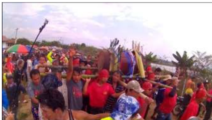
ภาพที่ ๒.๕ พิธีแก้มกลองส่งแก่น้ำ

๒ รูป วัดหัวข่วง ๑ รูป มาสวดธรรมแล้วพรมน้ำมนต์ (น้ำส้มป่อย) ที่ไม้สะหรีใจเมือง และตอนแห่ที่ ก้นกบ ก็นำพระสงฆ์มาสวดพระธรรมพุทธวงสา พรมน้ำมนต์ให้ผู้มาร่วมพิธีแล้วสวดขยันโต ๒๔