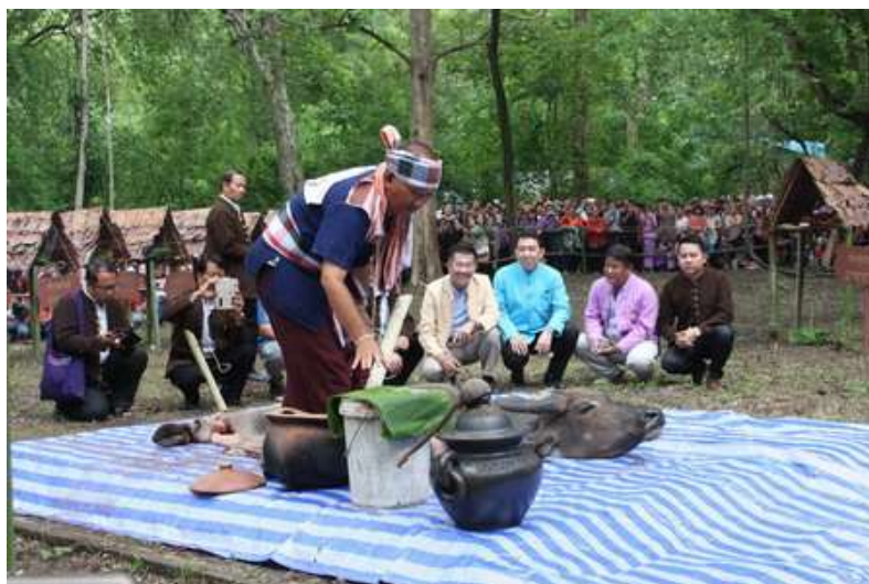
ภาพที่ ๒.๒ ประเพณีเลี้ยงผีปู่แสะย่าแสะ

(ที่มา: http://www.manager.co.th/QOL/ViewNews.aspx?NewsID=9590000060955 )