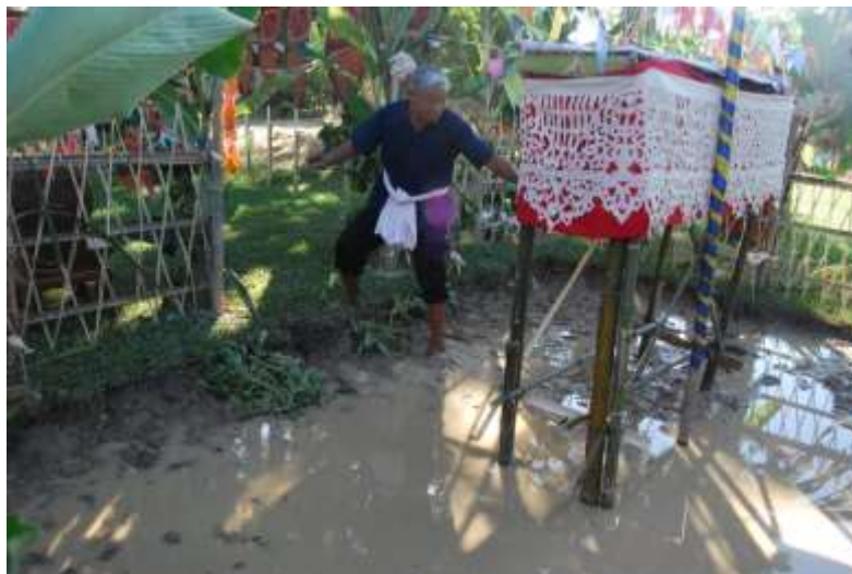
ภาพที่ ๒.๒๖ สระน้ำจำลอง

ประเพณีฟังธรรมปลาช่อนเป็นประเพณีพื้นเมืองที่น่าสนใจประเพณีหนึ่ง เป็นประเพณีที่สะท้อนให้เห็นถึงความเชื่อ ความศรัทธาของคนไทยในพระพุทธศาสนา และสะท้อนให้เห็นถึงความสัมพันธ์อย่างลึกซึ้งของคนไทยกับธรรมชาติคือสายน้ำ อีกทั้งอาชีพของชาวไทยอย่างเด่นชัด