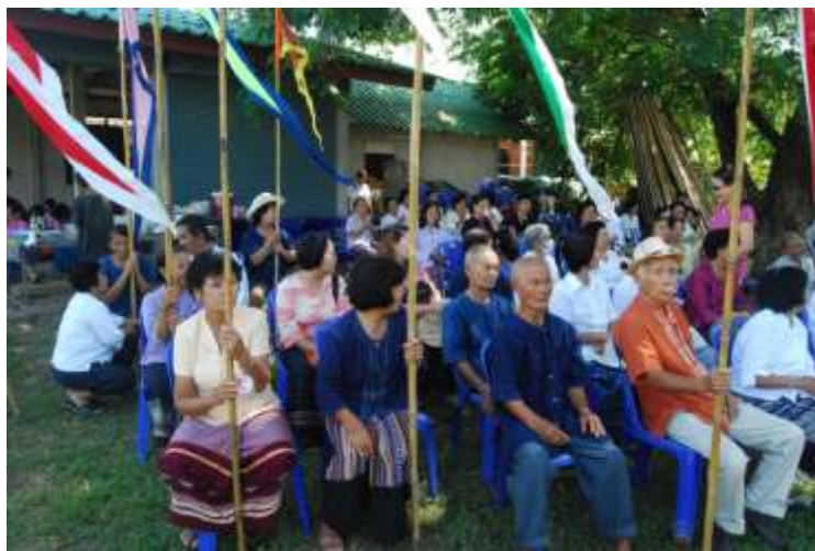
ภาพที่ ๓.๕ กลุ่มชาวบ้าน ผู้นำชุมชน และพระสงฆ์เข้าร่วมในพิธี

๖. ปรับความเห็นเข้ากันได้ คือ เคารพรับฟังความคิดเห็นกัน มีความเห็นชอบร่วมกัน ตกลงกันได้ในหลักการสำคัญ ยึดถืออุดมคติหลักแห่งความดีงาม หรือจุดหมายอันเดียวกัน