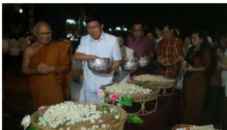
ภาพที่ ๒.๑๖ บุญแห่ข้าวพันก้อน

บุญแห่ข้าวพันก้อน คือ การนำเอาข้าวเหนียวหนึ่งมาทำเป็นก้อนๆ จำนวนพันก้อนไปบูชาพระรัตนตรัยที่วัด บางท้องถิ่นถึงฤดูทำนา ถ้าฝนไม่ตกชาวบ้านจะพร้อมกันทำพิธีแห่ข้าวพันก้อน โดยจัดเครื่องสักการะมีเทียนพันเล่ม รูปพันดอกดอกไม้พันดอก ข้าวเหนียวหนึ่งปั้นเป็นก้อนขนาดปลายก้อยจำนวนพันก้อน เมื่อผู้จะร่วมพิธีประเพณีไทยงานบุญแห่ข้าวพันก้อนพร้อมกันพร้อมแล้ว กล่าวคำป่าวร้องเทวดาและคำอ้อนวอนขอฝน เพื่อให้ฝนตกพร้อมกันแท้ไปรอบๆ หมู่บ้านมีการเล่นสาดน้ำกันไปตลอดทางเสร็จแล้วนำไปบูชาไว้ที่วัด ตามโบสถ์หรือในที่สมควร