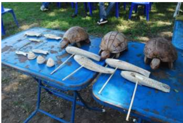
ภาพที่ ๒.๒๓ ไม้แกะสลักรูปปลา หอย เต่า