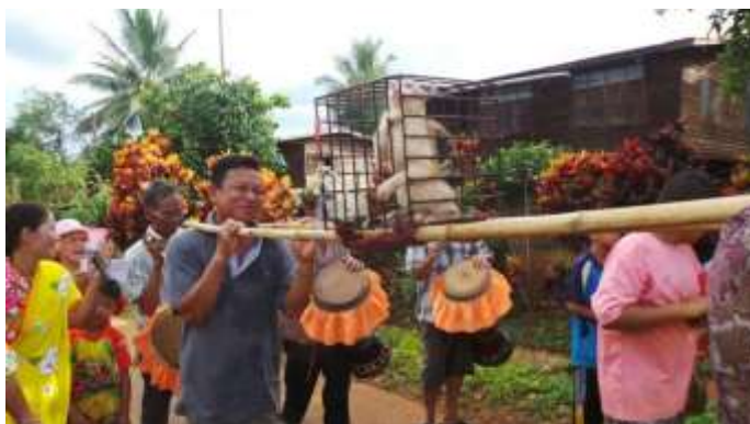
ภาพที่ ๒.๖ พิธีแห่นางแมว