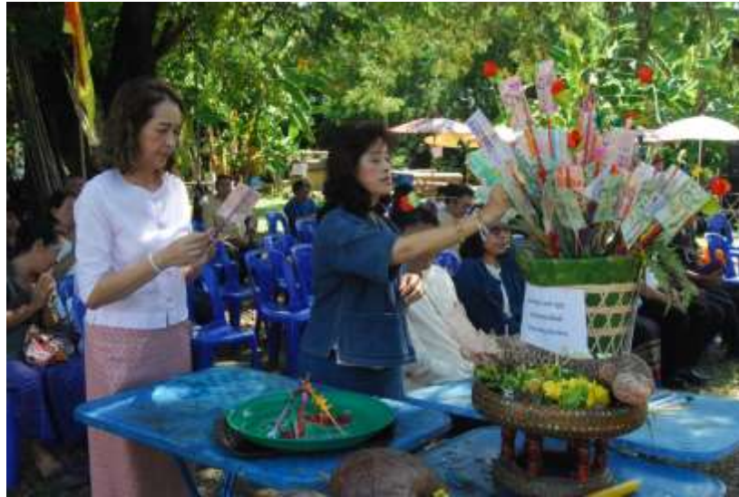
ภาพที่ ๔.๔ การร่วมทำบุญในพิธีเทศน์กรรมพญาปลาช่อน

จากเป้าหมายหลักของการเทศน์กรรมพญาปลาช่อน ก็เพราะว่าผู้คนในสังคมสามารถปฏิบัติถึงหลักสามัคคีธรรมได้อย่างจริงจังและเต็มเปี่ยมได้ ต้องมีศรัทธาความเชื่อมั่น ตามหลักพระพุทธศาสนาโดยศรัทธาจะต้องมีปัญหามาเป็นเครื่องกำกับด้วยเสมอ เมื่อคนมีศรัทธาที่มีปัญหาเป็นเครื่องชี้มาแล้ว จึงจะเป็นศรัทธาที่ประกอบด้วยเหตุผล เช่น เชื่อว่าสังคมจะไร้ปัญหาหากทุกคนลงมือปฏิบัติธรรมเหมือนกัน และศรัทธา ความเชื่อมั่น แบ่งออกเป็น ๔ ประเภท ประกอบด้วย