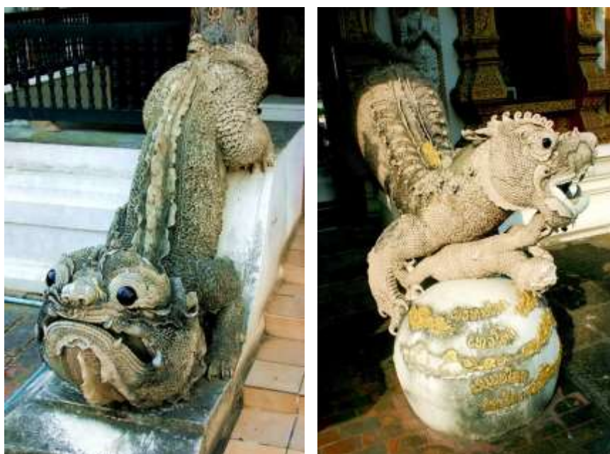
ภาพที่ ๒.๒๑ ตัวมอม

นอกจากนี้ ยังพบประติมากรรมตัวมอม นิยมประดับอยู่ตามวัด ทั้งแบบลักษณะประติมากรรมลอยตัว นูนสูง และนูนต่ำ มักปรากฏให้เห็นในรูปของส่วนประกอบในลวดลายประดับวัด รูปแบบศิลปกรรมบางแห่งปรากฏรูปเทวดายืนบนหลังมอม หรือยืนเอาเท้าข้างหนึ่งเหยียบลงบนศิระษะ หรือหลังของตัวมอม ซึ่งอาจหมายถึงเทวดาปชุนนะซึ่งเป็นเทพเจ้าแห่งฝนตามความเชื่อในสมัยก่อน โดยเมื่อในหมู่บ้านเกิดฝนแล้ง ชาวบ้านจะนำเอาตัวมอมที่แกะจากไม้ทำสมาธิร่วมกัน แล้วแห่ไปรอบหมู่บ้าน โดยเชื่อว่าตัวมอมจะบันดาลให้ฝนตกได้