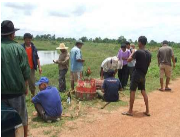
ภาพที่ ๒.๙ การเล่นโยนครกโยนสาก