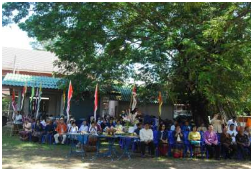
ภาพที่ ๔.๑๑ การเข้าร่วมสืบสานประเพณีเทศน์ธรรมพญาปลาช่อน

ประเพณีวัฒนธรรมถือเป็นมรดกทางวัฒนธรรมที่ล้ำค่าของชุมชน เพราะเป็นวิถีชีวิตของชุมชนที่แสดงถึงการดำรงตนของคนในสังคม คุณภาพชีวิตที่สมบูรณ์จะต้องตั้งอยู่บนรากฐานของคุณธรรมจริยธรรม ตลอดถึงประเพณีปฏิบัติที่สวยงามและเป็นระเบียบ ประเพณีจึงเป็นเครื่องชี้วัดคุณค่าของคน โดยมีธรรมเป็นเครื่องชี้นำพระพุทธศาสนาเข้าสู่วิถีชีวิตของคนไทย พร้อมๆ กับขนบธรรมเนียมประเพณีปฏิบัติ จนกลมกลืนเป็นเนื้อเดียวกัน ในสังคมอย่างแยกไม่ออก ประเพณีมีเพื่อให้คนได้ปฏิบัติ อย่างพร้อมเพรียงเกิดความสามัคคี ส่วนหลักธรรมเป็นคำสอนและเป็นแบบแผนให้ประเพณีดำเนินไปอย่างเหมาะสม ประเพณีจึงแยกไม่ออกจากหลักศีลธรรม ดังนี้