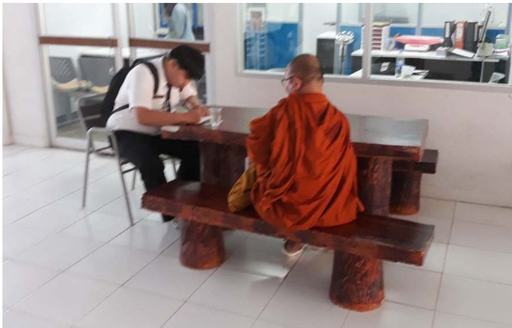
สัมภาษณ์นักศึกษา สาขาวิชาสาธารณสุขศาสตร์ มหาวิทยาลัยราชภัฏชัยภูมิ, เมื่อวันที่ ๔ ธันวาคม พ.ศ. ๒๕๖๑.