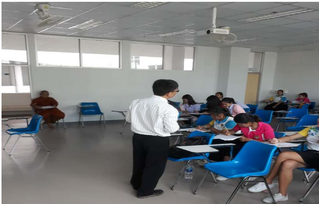
การจัดสนทนากลุ่มนักศึกษา สาขาวิชาการเงินและการธนาคาร มหาวิทยาลัยราชภัฏชัยภูมิ, เมื่อวันที่ ๑๑ ธันวาคม พ.ศ. ๒๕๖๑.