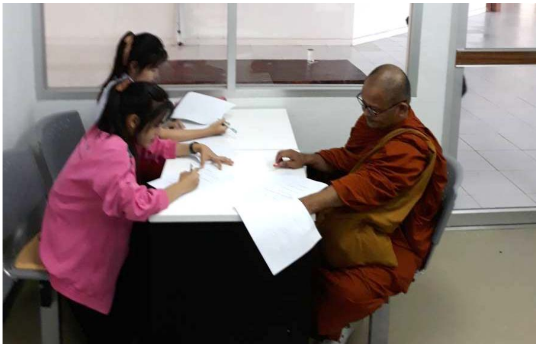
สัมภาษณ์นักศึกษา สาขาวิชาการจัดการ, มหาวิทยาลัยราชภัฏชัยภูมิ, เมื่อวันที่ ๔ ธันวาคม พ.ศ. ๒๕๖๑.