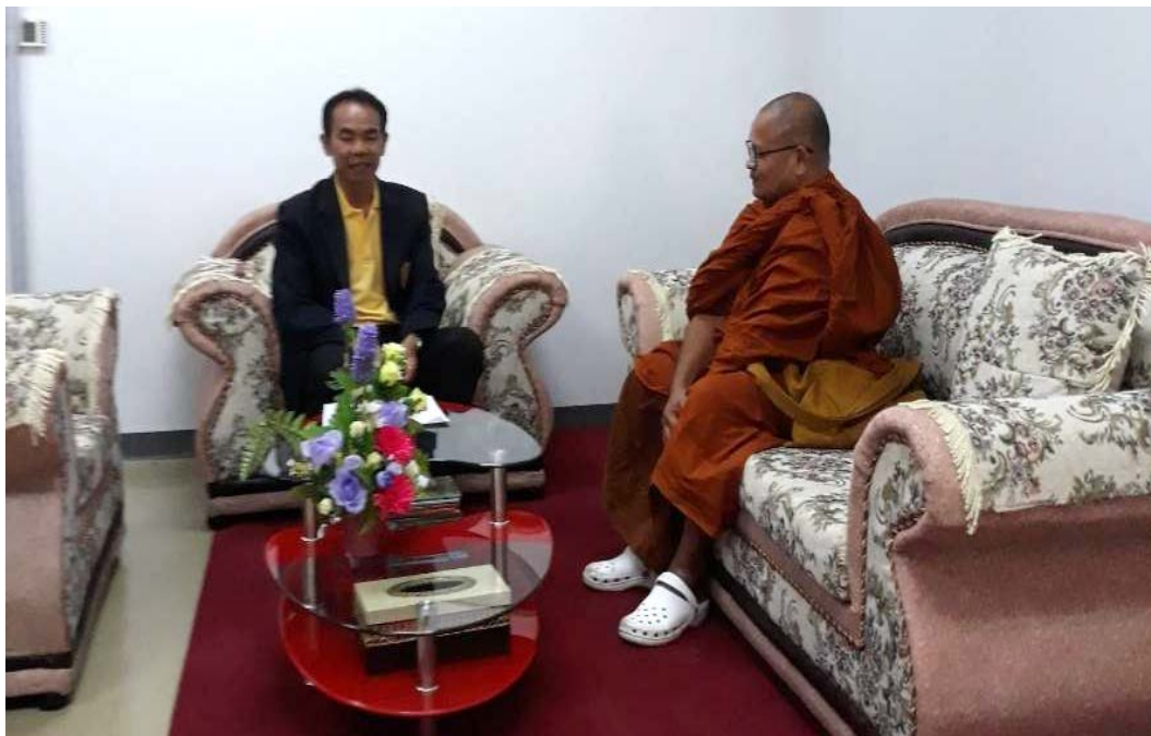
เข้าพบคณบดีคณะสาธารณสุขศาสตร์เพื่อขออนุญาตลงพื้นที่สัมภาษณ์ เมื่อวันที่ ๔ ธันวาคม พ.ศ. ๒๕๖๑.