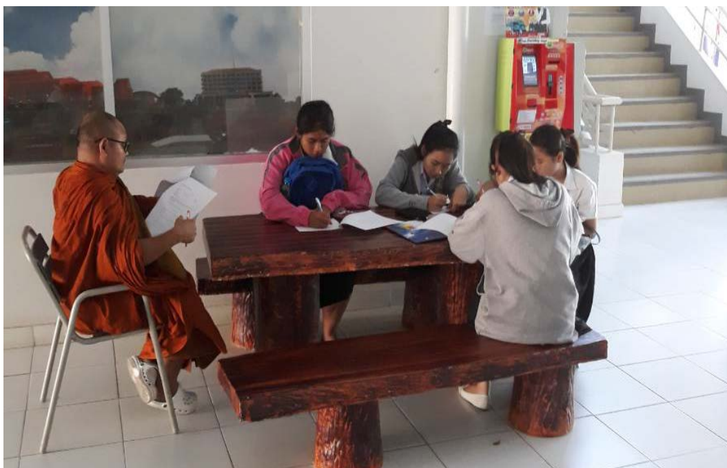
สัมภาษณ์นักศึกษา สาขาวิชาการจัดการ, มหาวิทยาลัยราชภัฏชัยภูมิ, เมื่อวันที่ ๔ ธันวาคม พ.ศ. ๒๕๖๑.