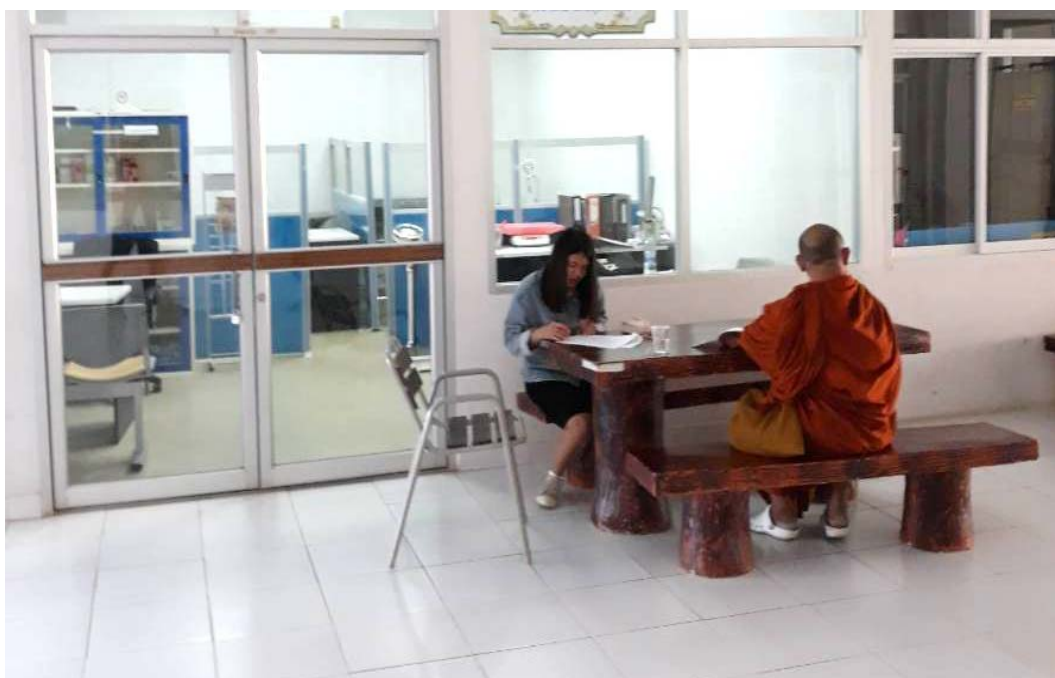
สัมภาษณ์ นักศึกษา สาขาวิชาสาธารณสุขศาสตร์ มหาวิทยาลัยราชภัฏชัยภูมิ, เมื่อวันที่ ๔ ธันวาคม พ.ศ. ๒๕๖๑.