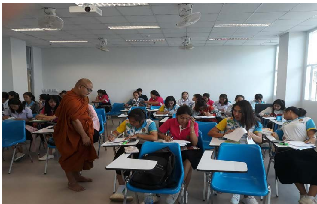
การจัดสนทนากลุ่ม นักศึกษา สาขาวิชาการเงินและการธนาคาร มหาวิทยาลัยราชภัฏชัยภูมิ, เมื่อวันที่ ๑๑ ธันวาคม พ.ศ. ๒๕๖๑