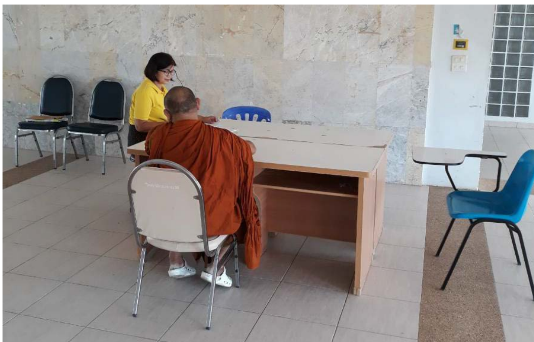
สัมภาษณ์อาจารย์ สาขาวิชาพยาบาลศาสตร์ มหาวิทยาลัยราชภัฏชัยภูมิ, เมื่อวันที่ ๔ ธันวาคม พ.ศ. ๒๕๖๑.