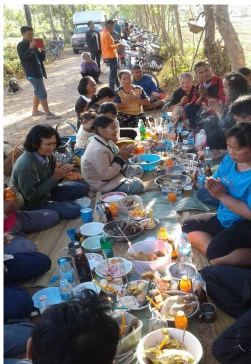
ผู้เข้าร่วมพิธีแซนผึ่ปู้ตา