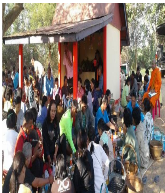
เก็บข้อมูลและสัมภาษณ์กลุ่มผู้ให้ข้อมูล