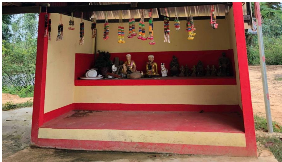
ศาลปู้ตาบ้านโสน ตำบลโสน อำเภอู่ซัน จังหวัดศรีสะเกษ