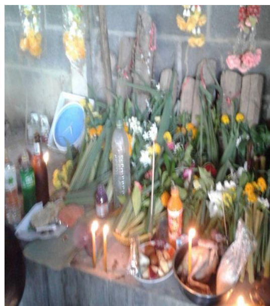
เครื่องบวงสรวง หรือเครื่องแซนผีปู้ตา