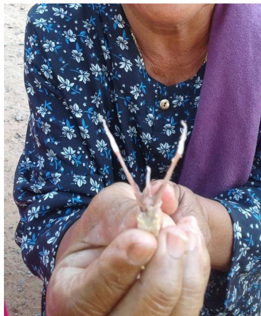
เสีียงทายกระดุกคางไก่