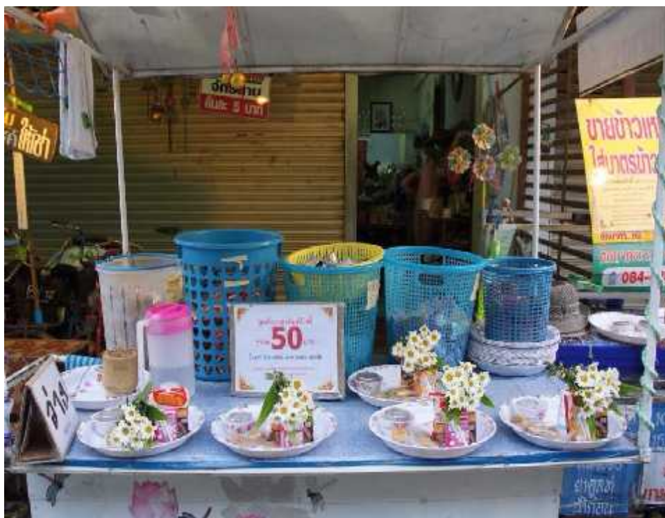
แผนภูมิที่ ๔.๒ แสดงภาพร้านขายชุดตัดกบาตร

กล่าวโดยสรุป การจะดำเนินการต่างๆ ให้สำเร็จลุล่วงได้นั้น ประเด็นสำคัญหลักคือ เรื่องของความคิดเห็นของคน ซึ่งในการอยู่ร่วมกันเป็นชุมชนของเชียงคานที่ปัจจุบันมีไขมีแต่ชาวเชียงคานเท่านั้น แต่มีคนนอกพื้นที่อาศัยอยู่ในฐานะนักลงทุน ดังนั้นหลักในการดำเนินการใดๆ อาจมีทั้งที่สอดคล้องกับความคิดเห็นของชาวเชียงคานดั้งเดิม และอาจมีประเด็นที่เห็นต่าง ๆ เป็นมูลเหตุให้เกิดความขัดแย้งได้ พุทธสันติวิธีเป็นวิธีการที่ผู้วิจัยพบว่า ชาวเชียงคานได้นำมาใช้เป็นหลักในการแก้ปัญหาเพื่อให้การจัดการท่องเที่ยวของเชียงคานเป็นไปด้วยความยั่งยืน