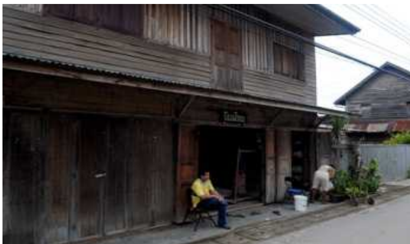
แผนภูมิที่ ๓.๓ แสดงภาพวิถีบ้านเรือนและสภาพความเป็นอยู่ของเชียงคาน