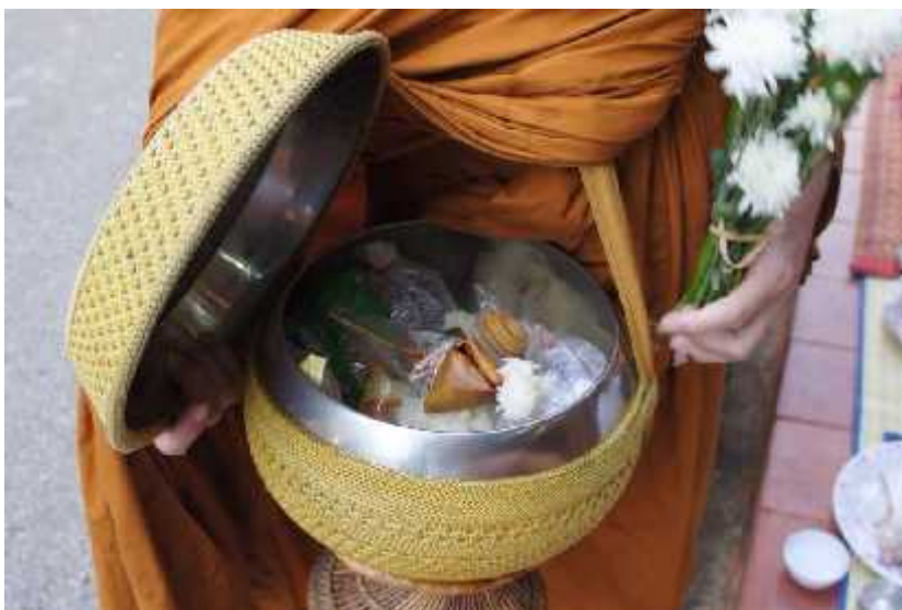
แผนภูมิที่ ๓.๒ แสดงภาพการใส่บาตรข้าวเหนียวของเชียงคาน