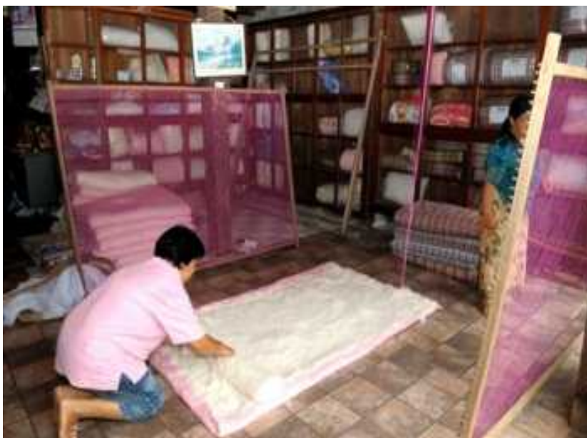
แผนภูมิที่ ๓.๑ แสดงภาพการผลิตผ้าห่มนวมของเชียงคาน