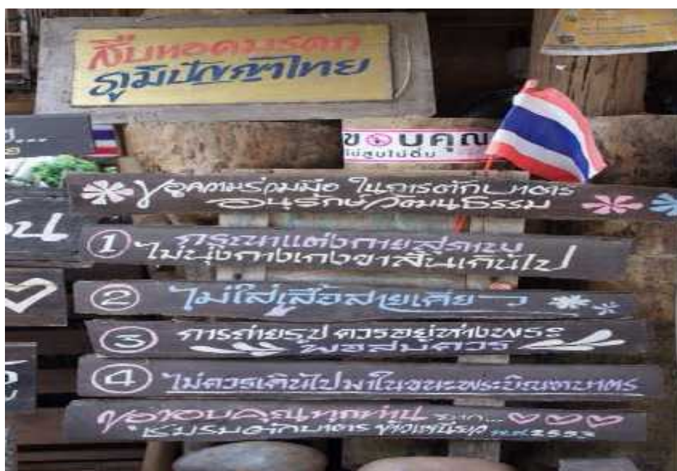
แผนภูมิที่ ๔.๑ แสดงภาพการรณรงค์ข้อปฏิบัติสำหรับนักท่องเที่ยวในการใส่บาตรข้าวเหนียว

นอกจากนี้ แนวทางการจัดการท่องเที่ยวที่ยั่งยืนโดยการจัดตั้งธรรมนูญเขียงคานนั้น สอดรับและเป็นไปในทางเดียวกับแนวคิดการจัดการท่องเที่ยวที่ยั่งยืนตามหลักสากลของ เซอร์ลี อีเบอร์ (Shirley Eber) ในด้านของการมีส่วนร่วม และการสร้างเครือข่ายพัฒนาการท่องเที่ยวเกี่ยวกับท้องถิ่น (Involving Local Communities) โดยผู้รับผิดชอบการพัฒนาการท่องเที่ยวมีการร่วมทำงานกับท้องถิ่นแบบเป็นองค์รวม (Participation Approach) โดยเข้าร่วมทำในลักษณะหน่วยงานร่วมจัด เช่น เป็นหน่วยงานร่วมทำกิจกรรมสาธารณะประโยชน์ เป็นหน่วยงานร่วมแก้ไขปัญหาด้วยกัน หรือเป็นหน่วยงานร่วมส่งเสริมการขายการท่องเที่ยวด้วยกัน เป็นต้นนอกจากนั้นยังต้องประสานเครือข่ายระหว่างองค์กรและท้องถิ่น เพื่อยกระดับคุณภาพของการจัดการท่องเที่ยวในท้องถิ่น และในด้านการหมั่นประชุม หรือปรึกษาหารือกับผู้เกี่ยวข้องที่มีผลประโยชน์ร่วมกัน (Consulting Stakeholders and the Public) ผู้รับผิดชอบการพัฒนาการท่องเที่ยวต้องประสานกับพหุภาคี ได้แก่ (๑) ชุมชนในพื้นที่ (๒) องค์กรปกครองส่วนท้องถิ่น (๓) กลุ่มผู้ประกอบการท่องเที่ยว (๔) สถาบันการศึกษา (๕) สถาบันการศาสนา (๖) หน่วยงานราชการที่รับผิดชอบในพื้นที่ร่วมประชุมปรึกษาหารือ เป็นการเพิ่มศักยภาพให้กับแหล่งท่องเที่ยวพร้อมกับหาทางป้องกันปัญหาที่ส่งผลกระทบต่อท้องถิ่น