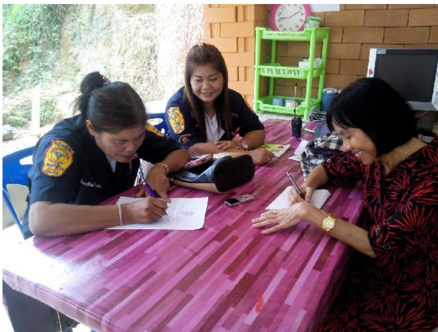
สัมภาษณ์ เจ้าหน้าที่สมาคมกู้ภัยตำบลคอกช้าง จังหวัดยะลา