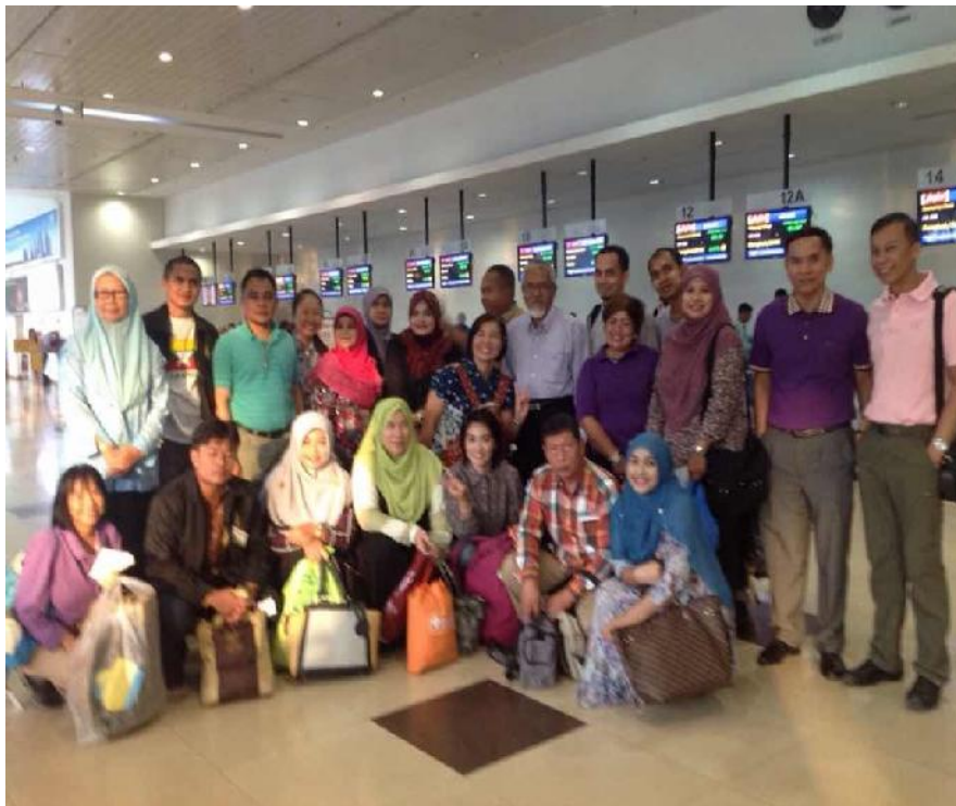
กลุ่มเครือข่ายเยาวยาเพื่อสันติภาพภาคใต้