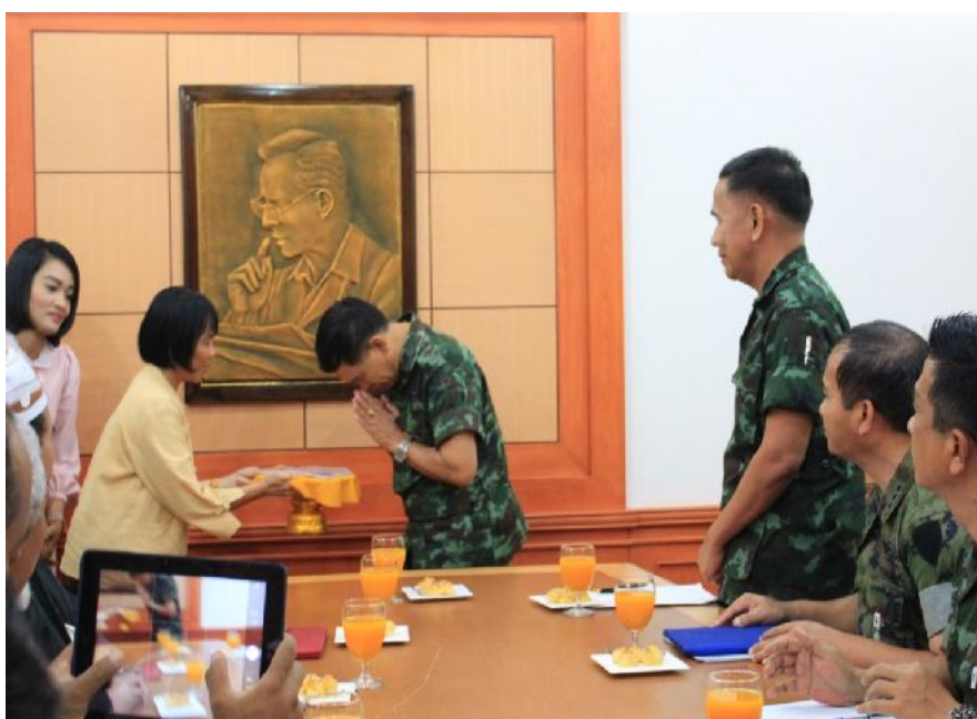
กิจกรรมเชื่อมสัมพันธ์กับหน่วยราชการ