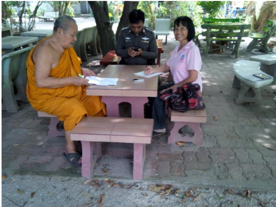
สัมภาษณ์ พระครูอุดมธรรมมาทร เจ้าคณะอำเภอยะหริ่ง, เจ้าอาวาสวัดปิยาราม สัมภาษณ์ วันที่ ๑๔ กันยายน ๒๕๕๘