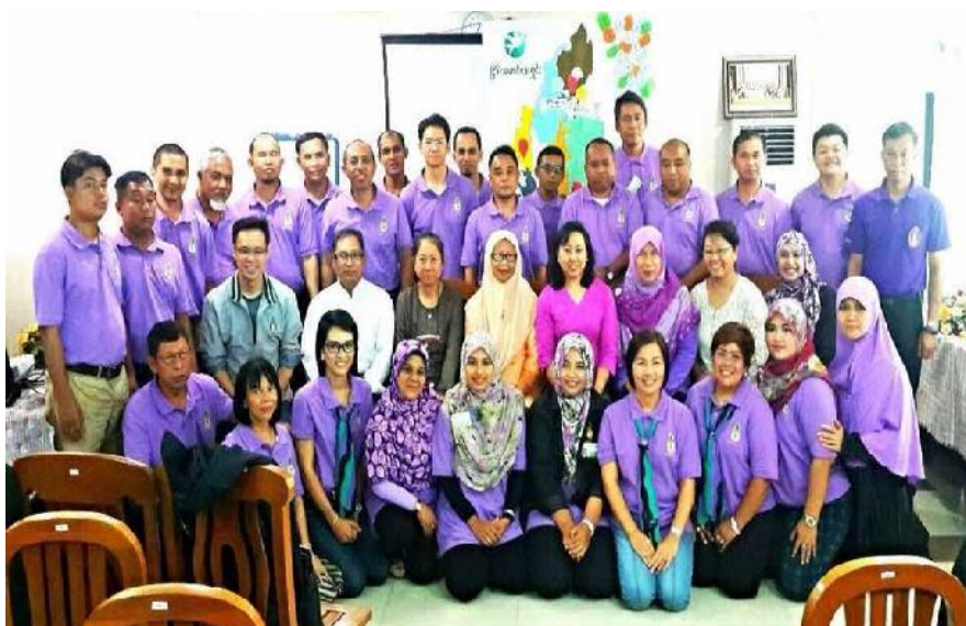
กลุ่มรณรงค์ให้บัญญัติพระพุทธศาสนาเป็นศาสนาประจำชาติในรัฐธรรมนูญ