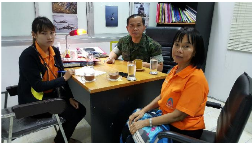
เข้าพบ นาวาเอก จักรพงษ์ อภิมาหารธรรม รองผู้อำนวยการนโยบายและแผนสำนักนโยบายและแผน กองอำนวยการรักษาความมั่นคงภายในภาค ๔ ส่วนหน้า (รอง ผอ.สนผ.กอ.รมน.ภาค ๔ สน.) เพื่อพูดคุยปรึกษาหารือ เรื่องการประชุมเครือข่ายพุทธธรรมนำสันติสุข เมื่อวันที่ ๑๑ กุมภาพันธ์ ๒๕๕๙ ณ ค่ายสิรินธร ต.เขาตวม อ.เมือง จ.ยะลา