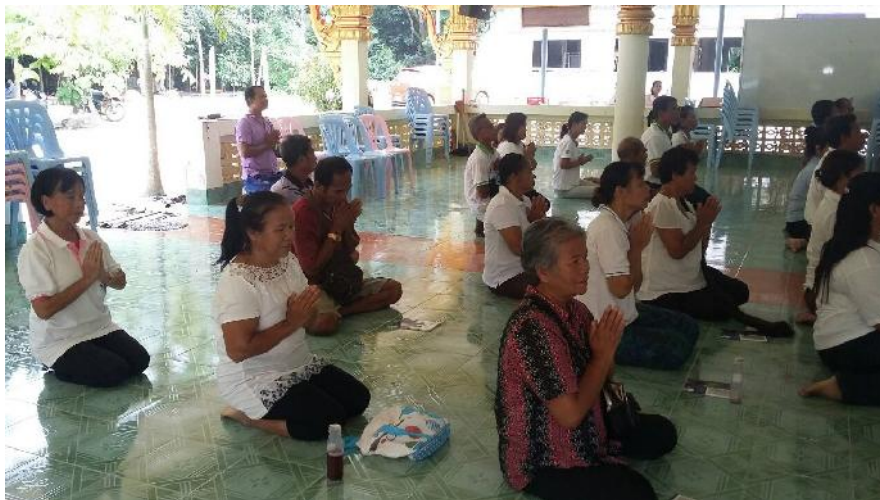
กิจกรรมการสวดมนต์ไหว้พระของกลุ่มเครือข่ายชาวพุทธเพื่อสันติภาพ