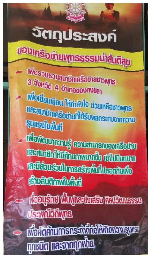
กลุ่มเครือข่ายเพื่อสันติภาพชาวพุทธ