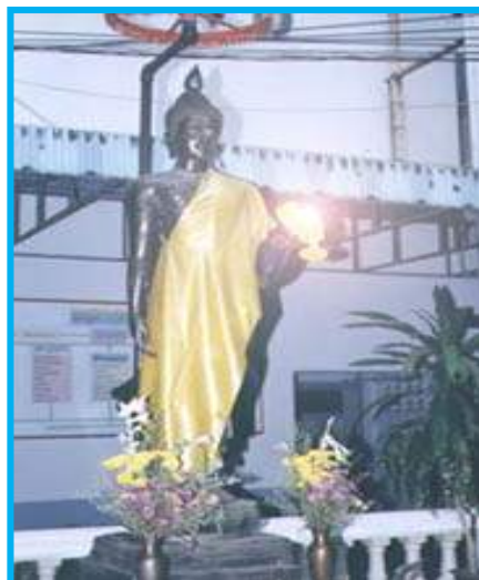
พระพุทธรูปปางลีลา