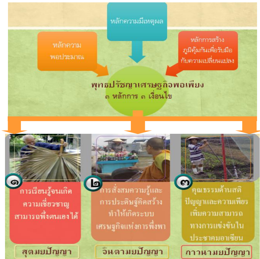
รูปที่ ๓ พุทธปรัชญาของเศรษฐกิจพอเพียง

เมื่อการแข่งขันกลายเป็นเงื่อนไขในการเตรียมรับมือกับสิ่งท้าทายทางเศรษฐกิจและภัยคุกคามรูปแบบใหม่ที่กำลังจะมาถึงหลังการรวมกลุ่มของประชาคมอาเซียน ดังนั้นต้องเจริญ “ภาวนามยปัญญา” หรือ “ปัญญาที่นำไปสู่คุณธรรม” ที่จะทำให้คนสามารถตอบสนองต่อการเปลี่ยนแปลงต่างๆ ได้ “ภาวนามยปัญญา” นั้นมีสติปัญญาและความเพียรเป็นพื้นฐาน คุณธรรมเหล่านี้จะทำให้ความรู้ต่างๆ เชื่อมโยงเข้าหากัน โดยเฉพาะการเชื่อมโยงความรู้กับท้องถิ่น ที่สามารถนำไปใช้ปฏิบัติได้จริงและมีประสิทธิผล ทำให้ระบบเศรษฐกิจมีความเข้มแข็งและชุมชนมีความพร้อมที่จะแข่งขันมากขึ้น