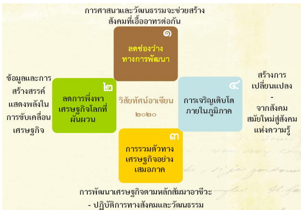
รูปที่ ๑ วิสัยทัศน์อาเซียน ๒๐๒๐

ในโลกยุคอาเซียน สิ่งที่ประชาคมอาเซียนต้องการดังที่ได้ระบุไว้ในวิสัยทัศน์อาเซียน ๒๐๒๐ คือ การรวมตัวทางเศรษฐกิจอย่างเสมอภาค ลดช่องว่างทางการพัฒนาและลดการพึ่งพาเศรษฐกิจโลกที่ผันผวน ประชาคมอาเซียนต้องการการเปลี่ยนแปลงเพื่อขับเคลื่อนสังคมให้เปลี่ยนจากสังคมสมัยใหม่ไปสู่สังคมแห่งความรู้ (Knowledge-based Society) ที่ข้อมูลมากมายและการสร้างสรรค์แสดงพลังในการขับเคลื่อนเศรษฐกิจ ขณะที่การศาสนาและวัฒนธรรมจะช่วยสร้างชุมชนของสังคมแห่งความเอื้ออาทร (A Community of Caring Societies) เพื่อลดช่องว่างทางการพัฒนา และการพัฒนาเศรษฐกิจตามหลักสัจมาอาชีวะจะทำให้เกิดการรวมตัวทางเศรษฐกิจอย่างเสมอภาค วิสัยทัศน์อาเซียน ๒๐๒๐ ทำให้รู้ว่า ถึงเวลาแล้วที่ชาวอาเซียนจะต้องลดการพึ่งพาเศรษฐกิจโลกที่ผันผวนนั้นเสียที